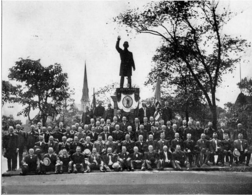
Group of Veterans of the Haymarket Riot, taken at Union Park, 1907

Le Monument à la police, sculpté par Johannes Gelert, a été inauguré en 1889, trois ans avant le Monument à Haymarket. On va y célébrer des commémorations annuelles, et il est très aimé de ceux qu'il représente le mieux : les policiers. Le quotidien local Chicago Tribune et le Union League Club de Chicago 7 ont organisé la levée de fonds pour le monument, qui devait être placé au centre de Haymarket Square – dans